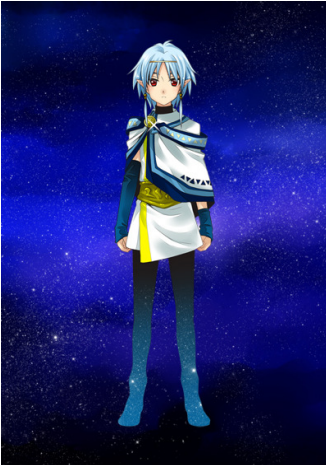
▲プレイヤーを導く 謎の少年 オステル

そう告げられ、あなたはオステルに導かれるまま、荒ぶる星「カオス」と輝く星「コスモ」をめぐる、夜の東京を舞台にした壮大な星たちの物語へと足を踏み入れる……。