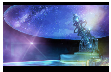
▲「コスモ」のレベルアップや合成、 入手はすべてここで行う

星座名：おひつじ座 名前：ハマル レベル：1 経験値：56/38 属性：火 生命力：50/50 力強さ：18 丈夫さ：10 正確さ：14 +4 素早さ：10 幸運さ：8 装備品：オーロラの飾り+2 スキル1：なし