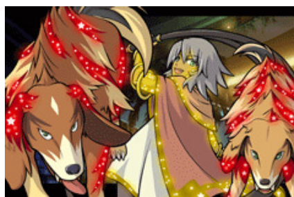
▲各ダンジョンには、さまざまなコスモ が立ちほだかる！！