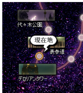
▲夜の東京が冒険の舞台