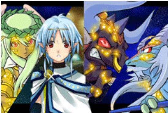
▲ 失われた女神の魂を探すストーリー 登場人物は魅力的

「星屑の大戦★コスモマキアー by GMO」の最大の特徴は、なんといっても魅力的な登場人物、88 星座をモチーフにした多彩なキャラクターたちが織りなすドラマティックなストーリーです。遊び方は、ストーリーに沿って進み、敵とのバトルも自動で進行するので至って簡単。誰でも気軽にゲームを楽しむことができます。