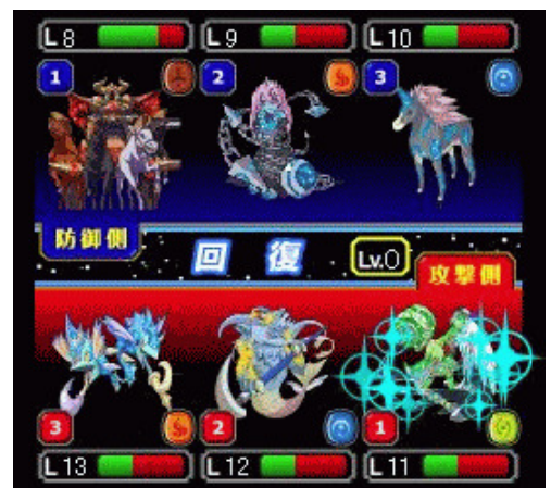
▲バトルは自動進行。 躍動する「コスモ」を楽しめる