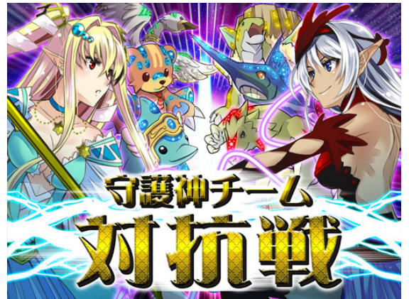
▲4人の守護神の下、育てた コスモで町の覇権を奪え！！